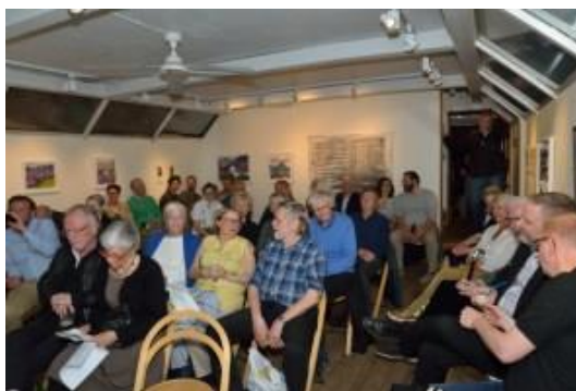
Mycket folk var det