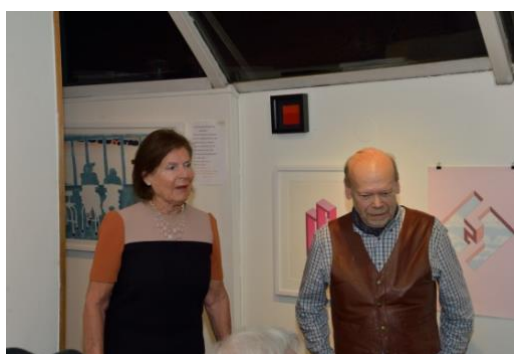
Samordnare Nordens Ljus/GLS