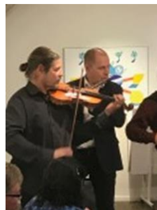
Lyxorkestern den 8 november