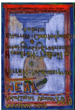
Konstnärsmenyn 19 november