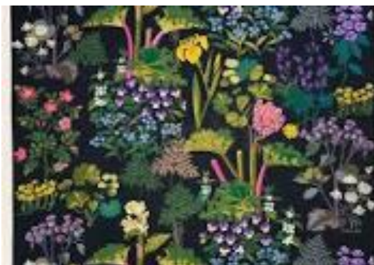
Ett av tygerna

Den 11 april var det ginprovning i glada vänners lag.