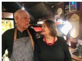
Det är roligt att jobba i baren

Ett 20-tal barmästare svarar för att medlemmar och deras gäster skall trivas ombord. Baren har haft öppet de kvällar klubben har aktiviteter och på lördagar. Torsdagarnas hemlagade soppor ”gillas” av medlemmarna.