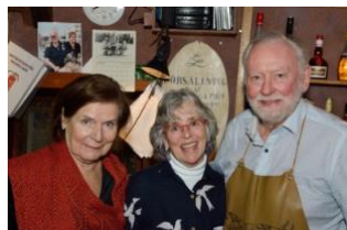
Barmorsa i fokus