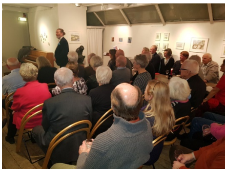
En stor publik följde Ranelid

Vi inledde säsongen 2018 STORT! Björn Ranelid gästade oss den 18/1 och berättade historier ur sitt liv och bidrog med en hel del tankar och åsikter om samhället.