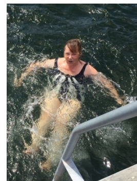
Det var 11 grader i vattnet