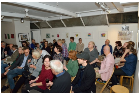
En stor publik har följt gitarrspelarna