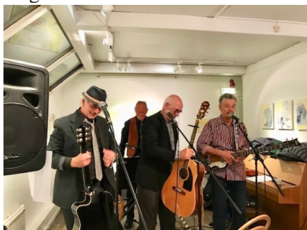
Perry & Pacemakers