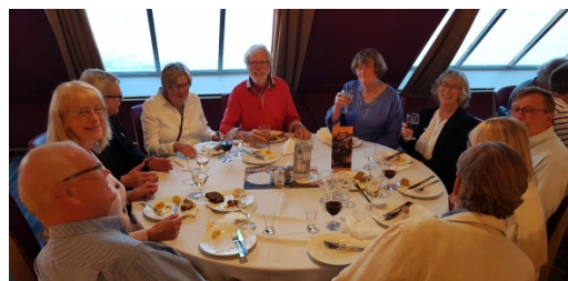
Ett glatt gäng på väg till Tallinn

Maj var en svår månad med många helger, som infann sig på torsdagar – men ett 20-tal Ljus åkte till Tallinn 15-17 maj och njöt av resa och studiebesök.