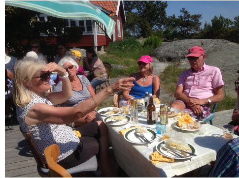
Besöket på Harö

Vårterminen avslutades med ett besök på Harö! Drygt 20 personer hade hörsammat inbjudan till utflykten i strålande sol.