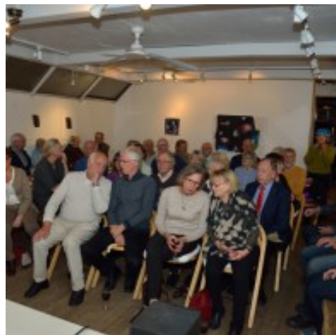
Kvällen den 13 oktober