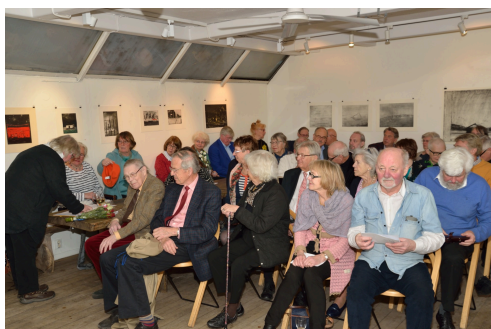
Några av deltagarna vid årsmötet