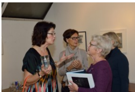
och man kunde köpa boken