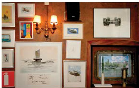
KULTUR. På nästan varje vägg på Nordens ljus hänger det konst.