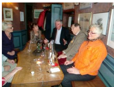
Samtal i baren.

lagade" rätter; lammfärsbiffar, potatis - gratäng, crepés och västerbottenpaj. Det har också funnits ett begränsat antal portioner från matsalens "dagens", samt våra standardrätter pytt, vårrullar och strömmingsmackor. I tillägg till standard-sortimentet av vin, vitt, rött och rosé, har det under året funnits ett alternativt finvin av respektive färg. Det senaste året har baren också kunnat erbjuda flera alternativa ölsorter. Numera serveras också månadens drink i baren.