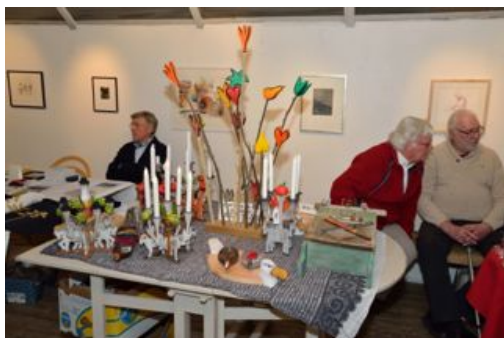
Samspråk och försäljning av ljusstakar

Det ekonomiska resultatet i form av provision på medlemmarnas försäljning blev drygt 3 000 kronor, pengar som går till Björnes minnesfond.