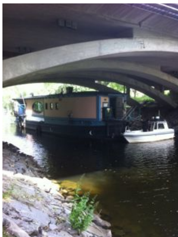
På väg till Kungsholmsstrand genom passagen vid Ekelundsbron.

Kajen vid Museet skulle genomgå renovering och pråmen blev av hamnen anvisad plats vid Kungsholms Strand. Tisdagen den 2 juli bogserades pråmen från Museikajen till Kungsholms Strand.