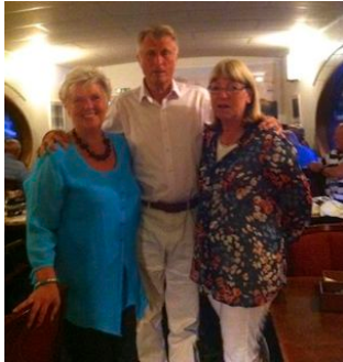
Ovan Nordens Ljusklubbens golfvinnare 2013

Ett 20-tal medlemmar genomförde för åttonde året i rad Klubbens golfmästerskap, som avslutades med buffé och prisutdelning ombord. Mer information om de olika aktiviteterna finns på Nordens Ljusklubbens hemsida.