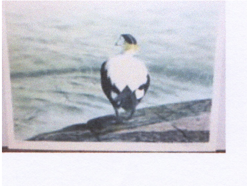
Stockholm i mars 2014

När detta skrivs har det nya "ljusåret" som blir vårt 30:e kommit en bra bit på väg och det är styrelsens ambition att tillsammans med alla våra klubbmedlemmar göra också 2014 till ett ljusare år. Vi fortsätter på den nya platsen vid Kungsholmsstrand att i Björnes anda "göra klubben till ett vattenhål, kring vilket alla medlemmar kan flockas".