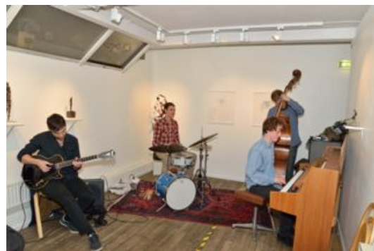
Husbandet sista tisdan